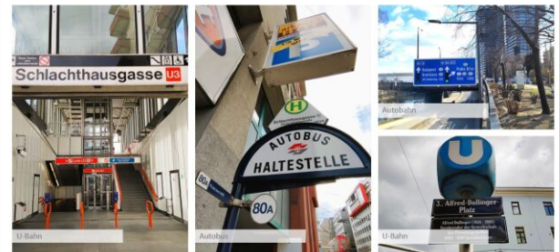
Öffentliche Verkehrsmittel befinden sich in unmittelbarer Umgebung.