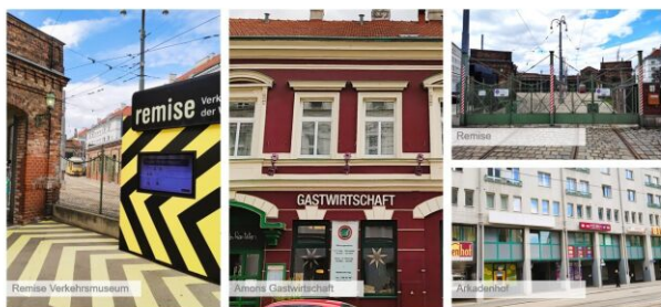
In der Umgebung befinden sich viele verschiedene Einkaufsmöglichkeiten, Lokale und Sehenswürdigkeiten.