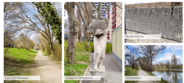
In der Umgebung befinden sich viele verschiedene Lauf- Wander- und Radwege.